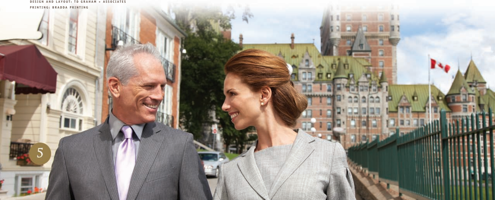
DESIGN AND LAYOUT: TD GRAHAM + ASSOCIATES PRINTING: BRADDA PRINTING